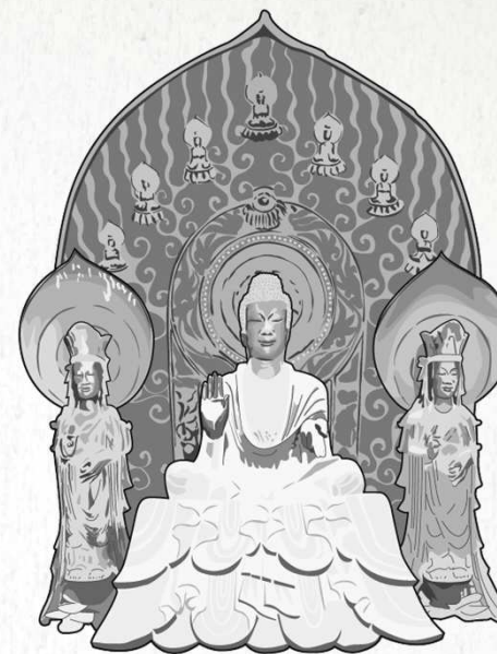
法隆寺の釈迦三尊像