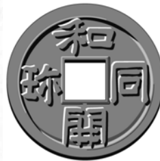
わどうかいちん 和同開珎

奈良の都。 人口10万人で 日本最大。 市で品物が 販売され 都周辺で貨幣が流通した。